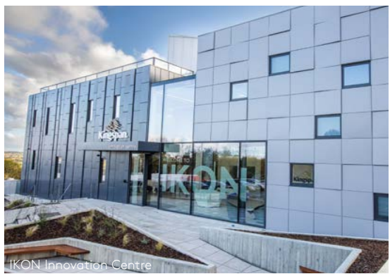
IKON Innovation Centre

Przywództwo na każdym poziomie jest kluczowym elementem naszego kodeksu postępowania i oczekujemy, że nasi dyrektorzy zarządzający i wszyscy kierownicy będą dawać przykład i udzielać wskazówek swoim pracownikom, aby postępowali w sposób uczciwy, rzetelny i zgodny z prawem. Oczekujemy również, że nasi dyrektorzy zarządzający dopilnują, aby wszyscy pracownicy mieli dostęp do niniejszego Kodeksu Postępowania i aby osoby zgłaszające wątpliwości w dobrej wierze były w pełni wspierane.