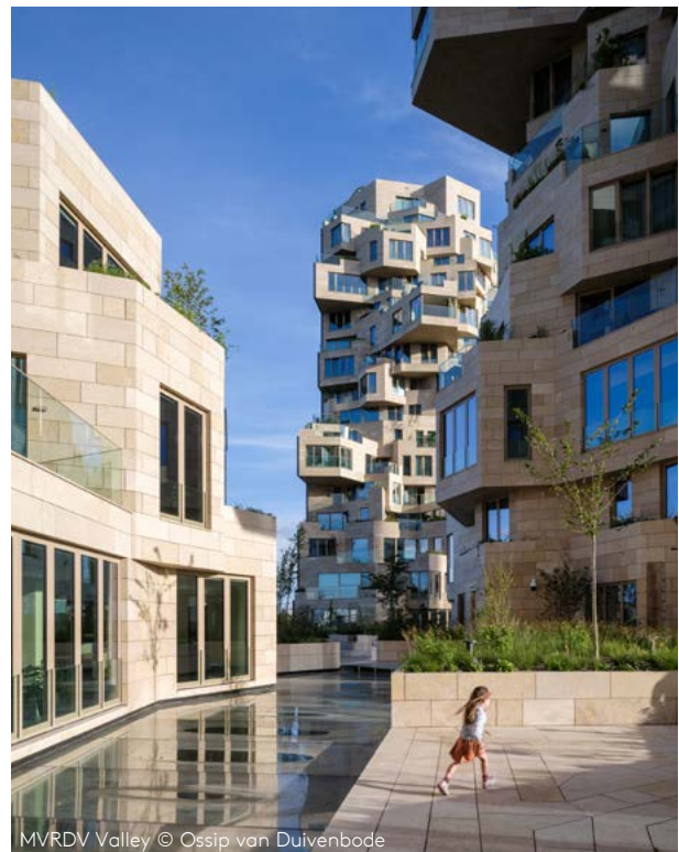
MVRDV Valley

W transakcjach handlowych lub w przypadku komunikowania się w temacie naszej działalności, obowiązkiem każdego jest komunikować się w sposób jasny i zgodny z prawdą, a także być szczerym we wszelkich twierdzeniach, które są składane w formie ustnej, pisemnej lub online.