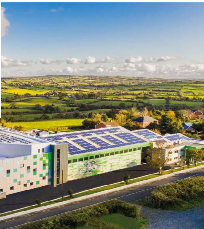
IKON Innovation Centre